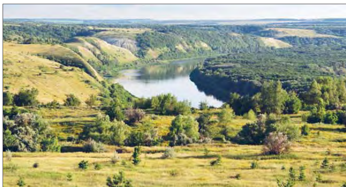
Красоты родного края.

По горизонталю: Матадор, Траса, Карма, Жабо, Танк, Срам, Сулема, Драже, Омон, На- га, Расход, Клякса, Кабаре, Аромат, Иркут, Вето, Икарус, Аллея, Ласт. По вертикали: Директива, Бархат, Баланс, Бокал, Муссон, Кеонкрация, Туака, Адлер, Слот, Овал, Джур, Ремарк, Мера, Мрамор, Статус, Пира, Манам, Тост.