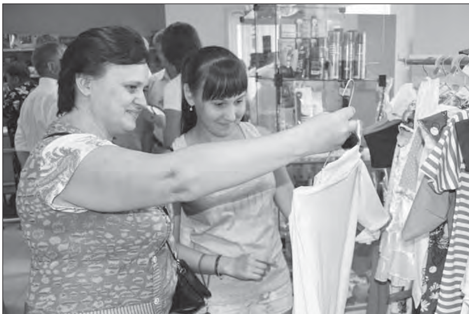
У товарных рядов пусто не было.