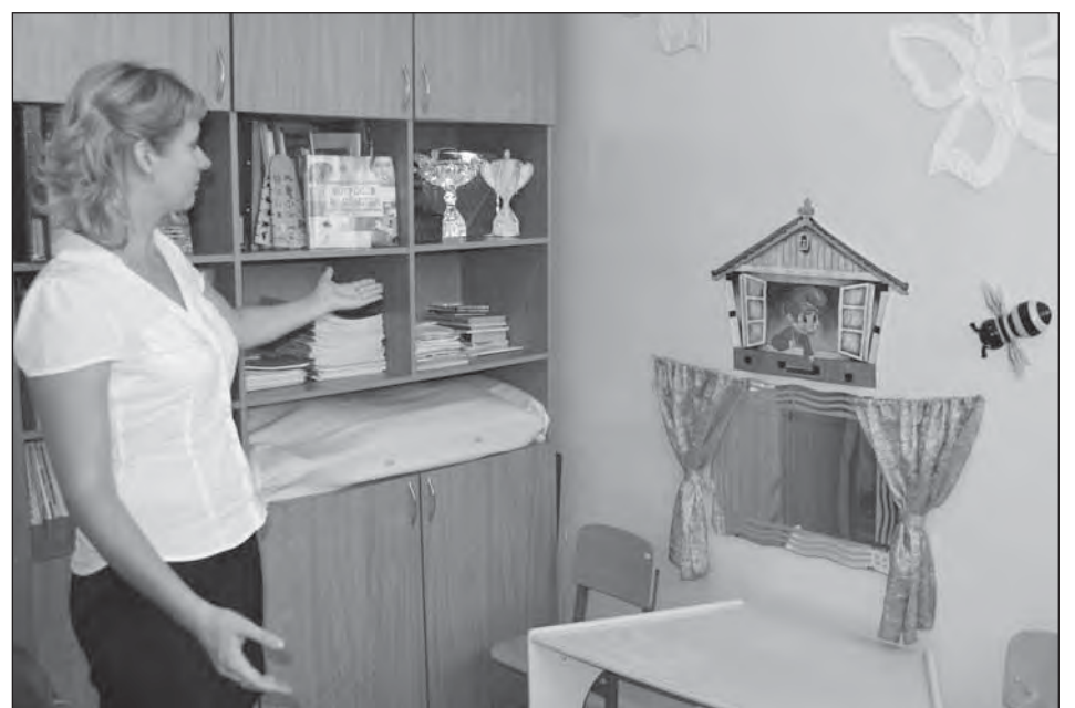
■ Начало лекотеки положено.

С интересующими вопросами обращайтесь по адресу: г. Богучар, ул. Дзержинского, 40. Телефон 2-16-41.