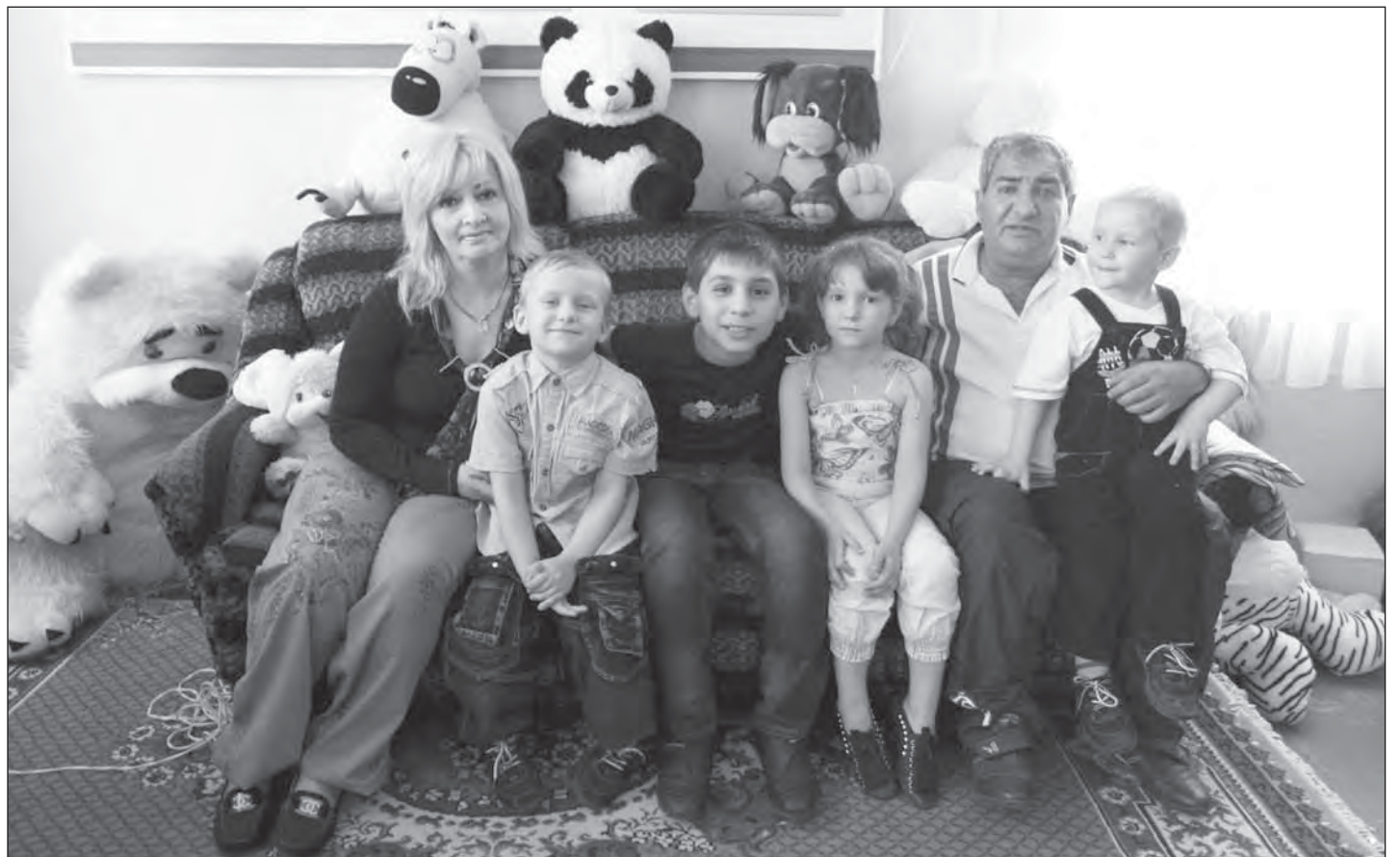
■ Счастливое семейство.

Не так давно у нас появилась еще одна приёмная семья. Раньше в ней под опекой воспитывался мальчик, которого в