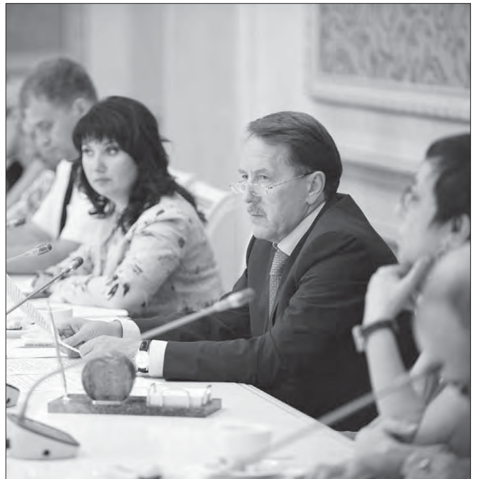
■ Алексей Гордеев ответил на вопросы журналистов.

— Власть очень хочет, чтобы люди могли получать дополнительные доходы, трудясь на своих подворьях. Но с разведением свиней мы попадаем в тяже-