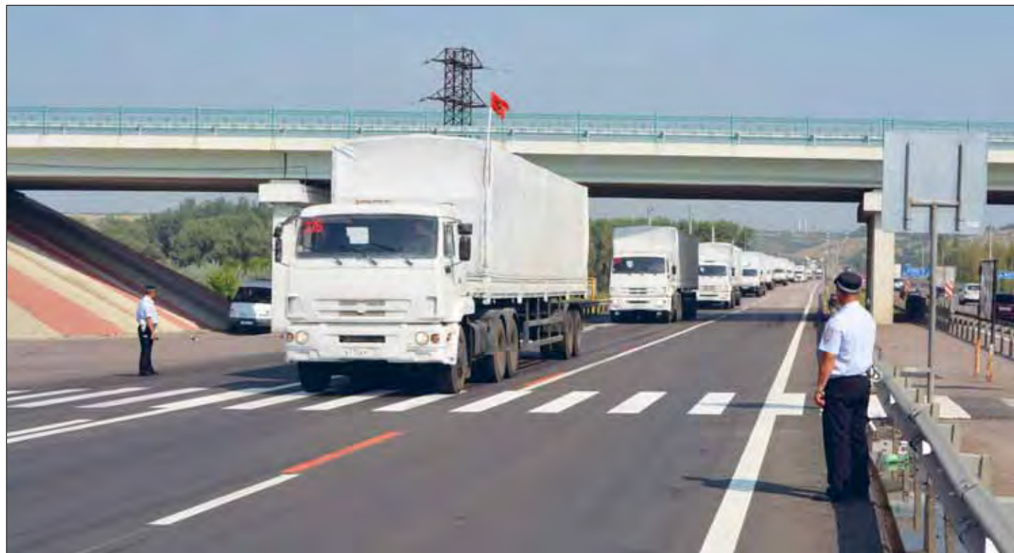
Колонна держит путь на Ростов.

Около 300 грузовиков проехали по трассе М-4 «Дон» в сторону Ростовской области