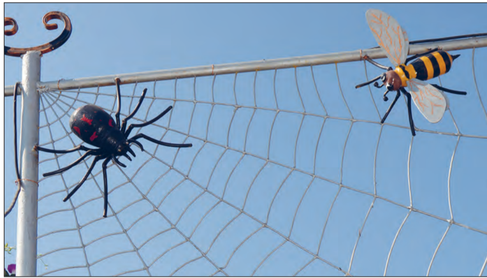
■ Воздушное «свидание».