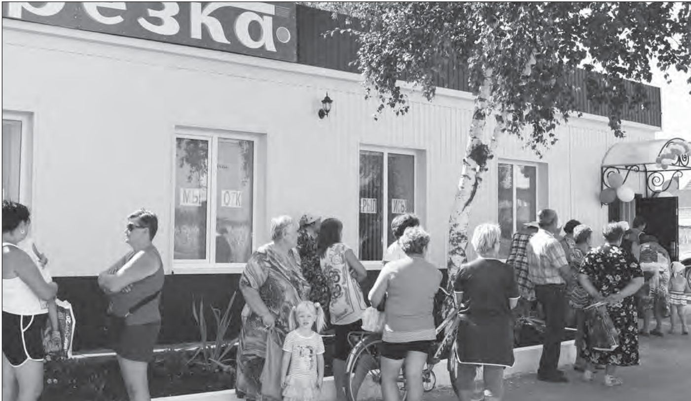
Посмотреть на обновленный магазин пришло немало селян.

Местные власти сделали очередной шаг к тому, чтобы жизнь селян стала комфортнее