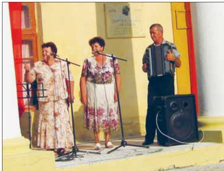
■ Играй, баян, лейся, песня!