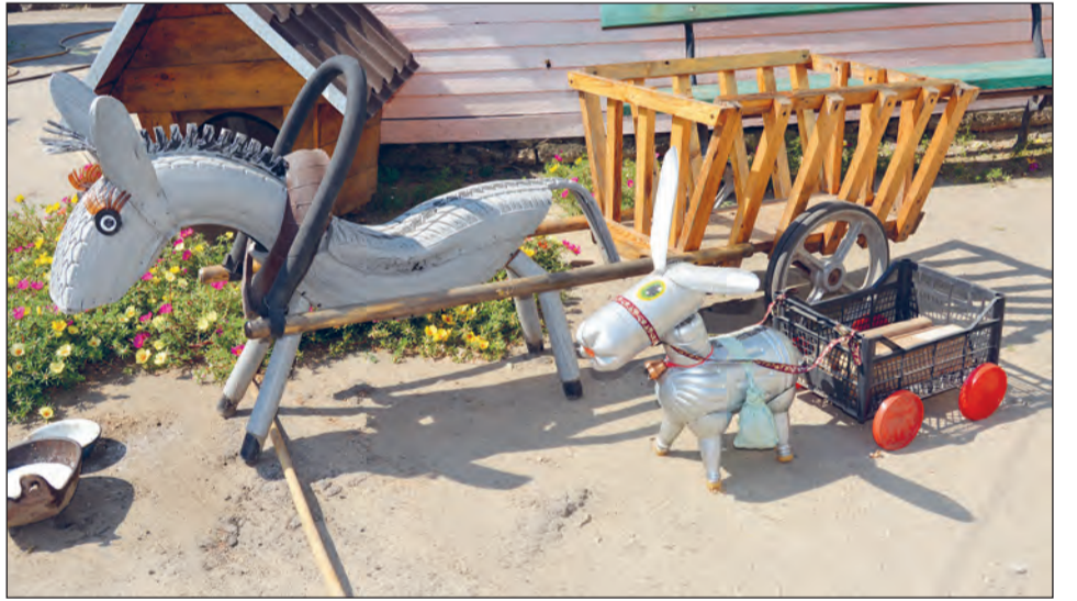
■ Сладкая парочка.