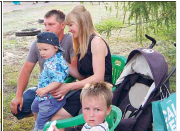
■ На праздник – всей семьей.