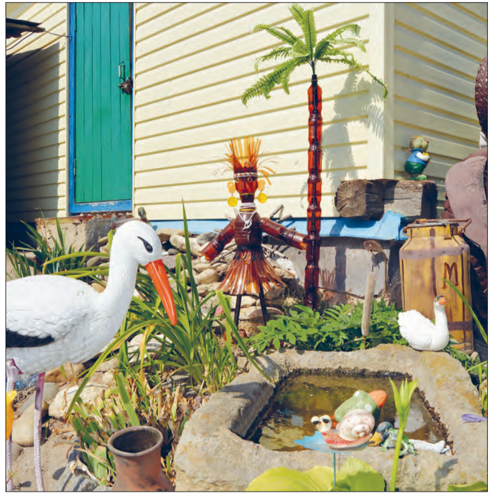
■ Сплошная экзотика.